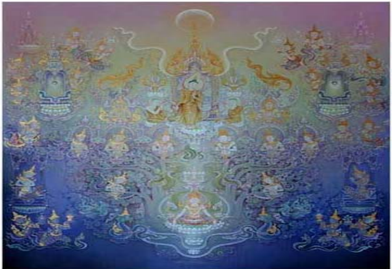
"ทรงโปรดเทพพรหม"